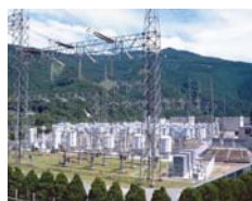
佐久間周波数変換所