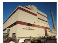
パーチウッド石炭火力発電所 (米国)

*海外コンサルティング事業および海外発電事業の実施状況についてはP29をご参照ください。