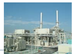
ベイサイドエナジー市原発電所 (PPS)