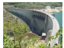
ビクトリアダム(スリランカ国)