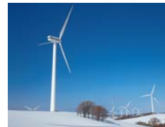
古前ウィンピラ発電所