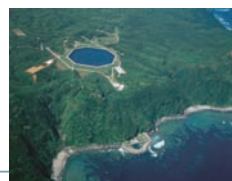
沖縄やんばる海水揚水発電所