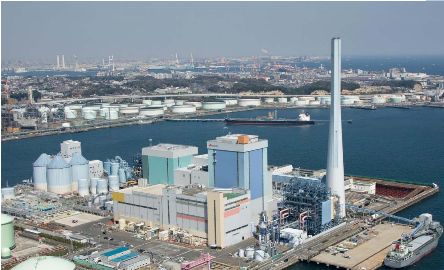
磯子火力発電所(横浜市)