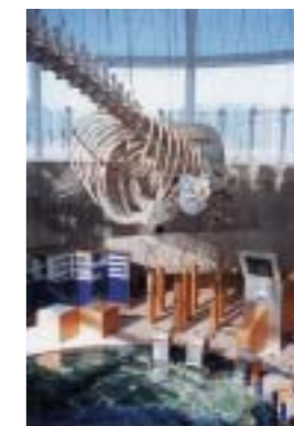
でんぱつ・よんでんWanダーランド

2000年12月に橋湾火力発電所(徳島県)の対岸に、「でんぱつ・よんでんWanダーランド」がオープンしました。この施設は発電所建設に利用した土捨場の跡地を四国電力と当社が共同で地域の方が憩える場所として整備したものです。