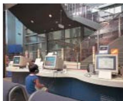
奥清津第二発電所

奥清津第二発電所(新潟県)は、水力発電所の発電機や配電盤など実物の設備が見学できる開放型発電所です。2001年度は19,660人の方々に見学していただきました。