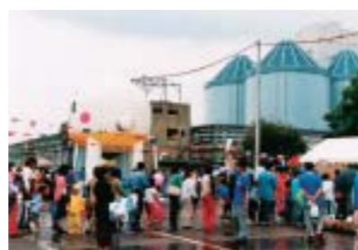
発電所開放デー(礪子火力発電所)

当社では、地域の皆様との交流を図るため、発電所開放デーを定期的実施しています。開放デーでは、所員が構内で育てた花や野菜の苗を配布するなど、多彩なイベントを通じて地域の皆様との交流を図るとともに、施設見学を通じて当社事業への理解活動を行っています。