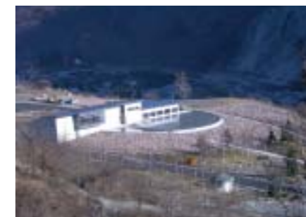
MIBOROダムサイドパーク

2001年4月に「MIBOROダムサイドパーク」がオープンしました。御母衣ダム(岐阜県)の建設の歴史や「荘川桜」誕生にまつわるドラマを紹介するPR施設や、御母衣のダムを眺めながら食事ができるレストランがあります。