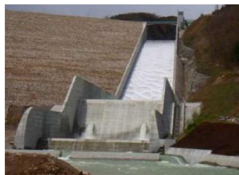
融雪期の洪水吐きからの越流状況