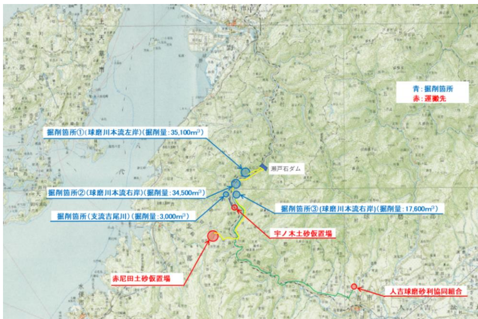
【堆砂掘削箇所および運搬先】