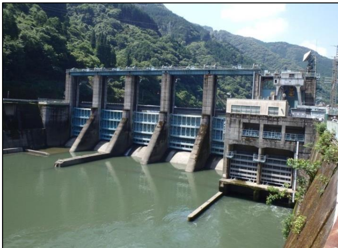
瀬戸石ダム(下流側より)