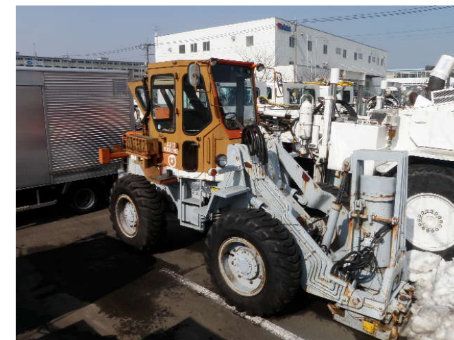
図3 弾性波探査に使用する油圧インパクト（事例）