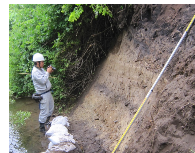
図5 露頭調査作業状況（事例）