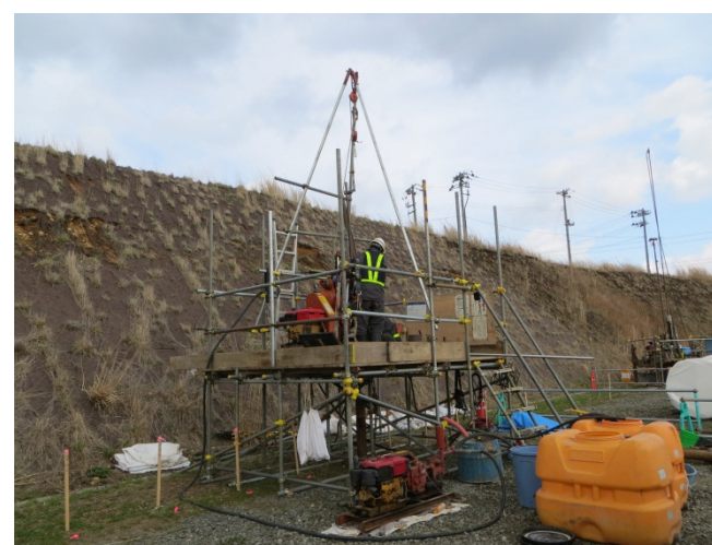
図4 ボーリング調査作業状況（事例）