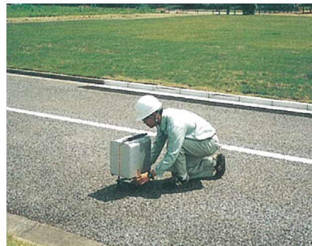
図2 重力探査作業状況（事例）