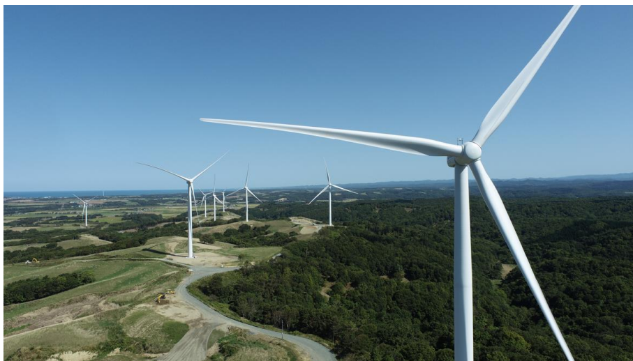
新苫前ウィンビラ発電所

Jパワーグループは、これまでの全国各地における風力発電所運営の経験と実績を踏まえ、高経年化の進んだ地点の設備更新を順次実施しています。今後も、2021年2月にJ-POWER “BLUE MISSION 2050”で掲げたカーボンニュートラルの実現に向け、風力発電をはじめとした再生可能エネルギー事業の持続的な開発と安定運転に努めていきます。