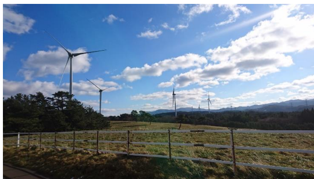
株式会社ジェイウインドが保有する風力発電所