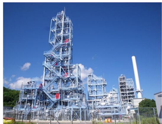
電源開発若松研究所の物理吸収法実証試験プラント ※本事業は若松研究所での試験成果を反映