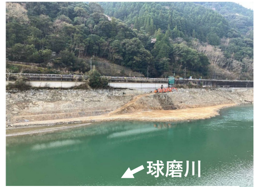
掘削箇所②(球磨川本流右岸)