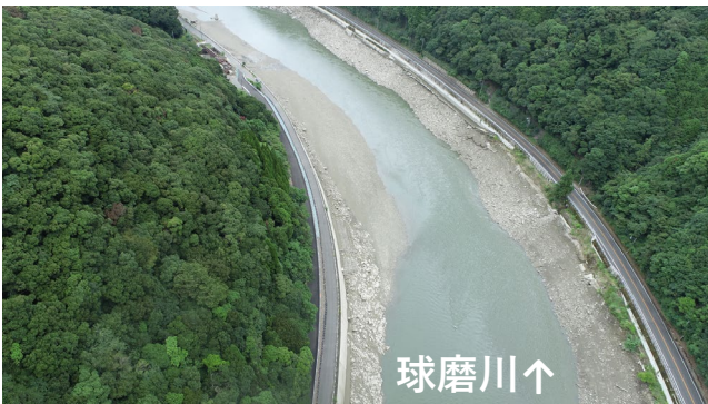
掘削箇所③(球磨川本流左岸)