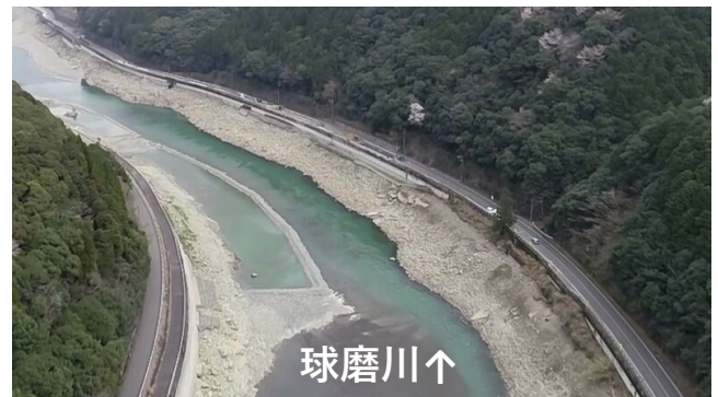
掘削箇所③(球磨川本流左岸)