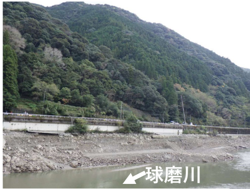
掘削箇所②(球磨川本流右岸)