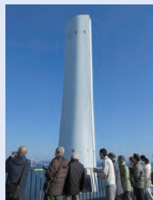
株主様向け施設見学会 (写真の設備は磯子火力発電所の煙突)

J-POWERでは、株主総会だけでなく、株主様向け施設見学会や個人投資家の皆様を対象とした会社説明会、機関投資家の皆様との個別面談などを通して、株主・投資家の皆様に当社事業についてご理解いただくとともに、いただいたご意見を経営で共有し、事業運営に役立てています。