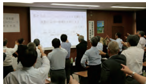
安全衛生大会時の安全唱和(昨年度開催時)