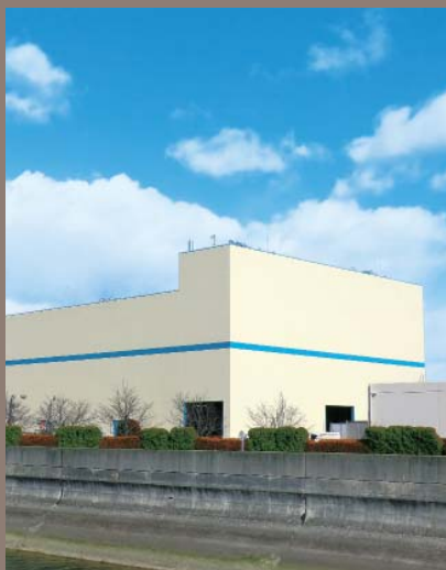
広島市西部水資源再生センター 燃料化施設(広島県)