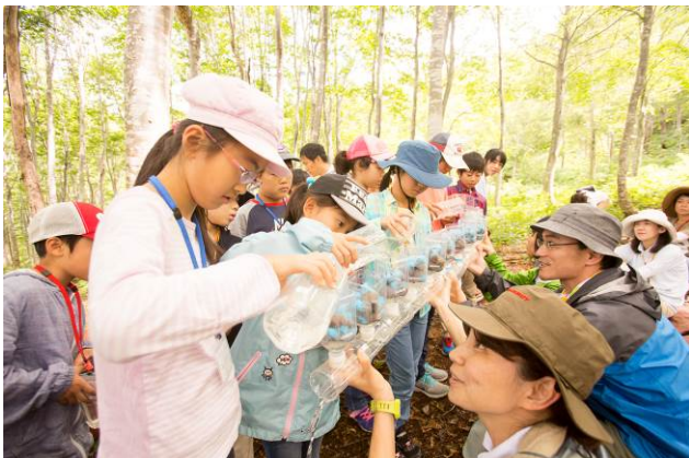
○実験で森を作ります。