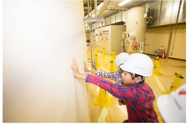
○これが、電気の生まれる音か！