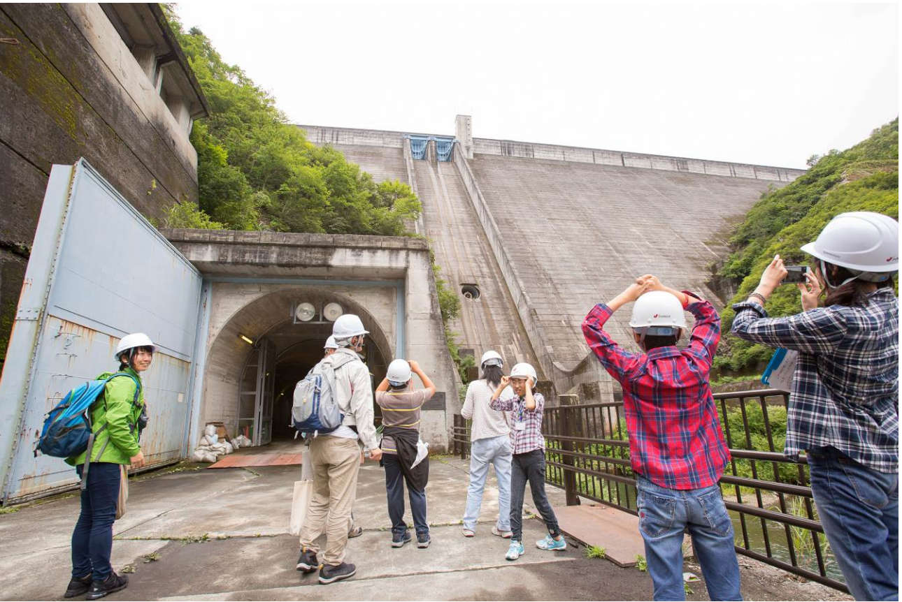
○さっきまでの場所があんなに小さい！