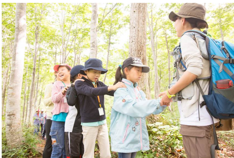
○目をつむって歩いてみたら…？大丈夫、おのがしっかり手を引いてるよ！