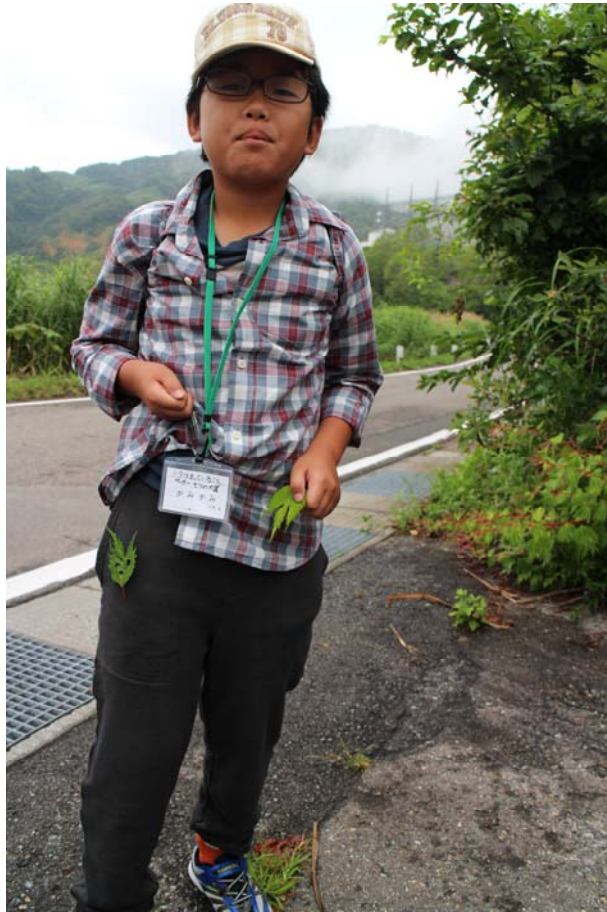
○エンブレムを付けて、誇らしげ。

朝ご飯を食べたら緑の学園をチェックアウト。名残惜しいですが、ブナの森が待っています。おっと、ブナの森に入る前には、銀山平名物のアレが待っています！