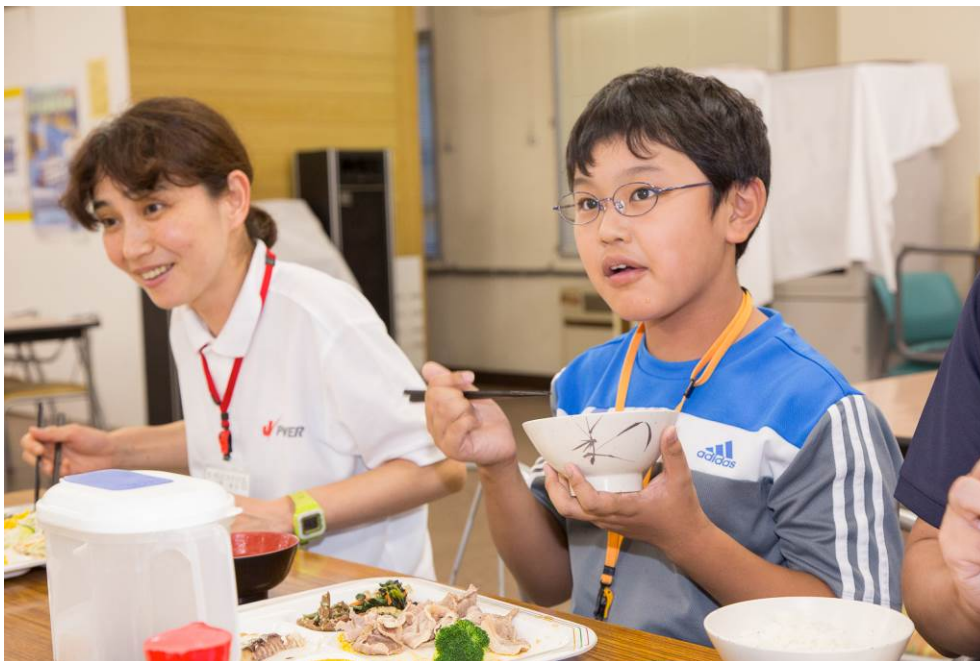
○モリモリ食べよう！

夕方になり、ようやく今夜の宿泊施設 「緑の学園」 にチェックインです。 お腹ペコペコお待ちかねの夜ご飯！地元新潟産の食材をふんだんに使ったメニューでした。もちろんお米は魚沼産コシヒカリ！ご飯だけでご飯が進みます！！