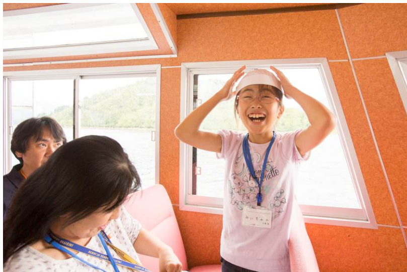
○ヘルメットを被る準備。それだけでテンションMAX！！