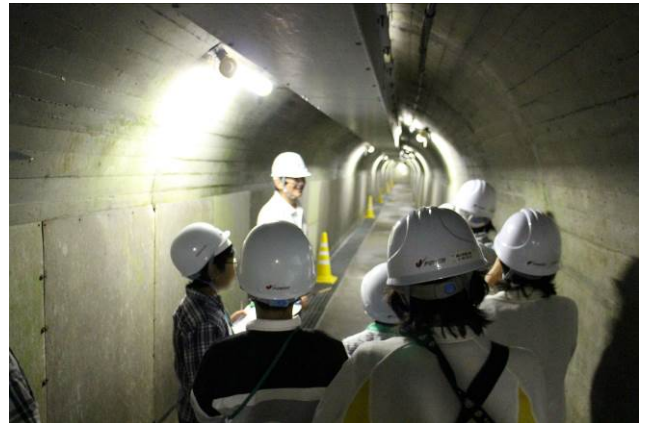
○さて、ダムと発電所の見学に出発だ！