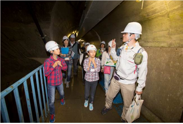
○ドキドキ、わくわくの発電所見学へ。