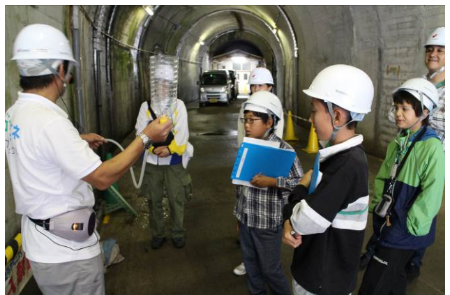
○実際に見た発電機の仕組みを実験でおさらいします。