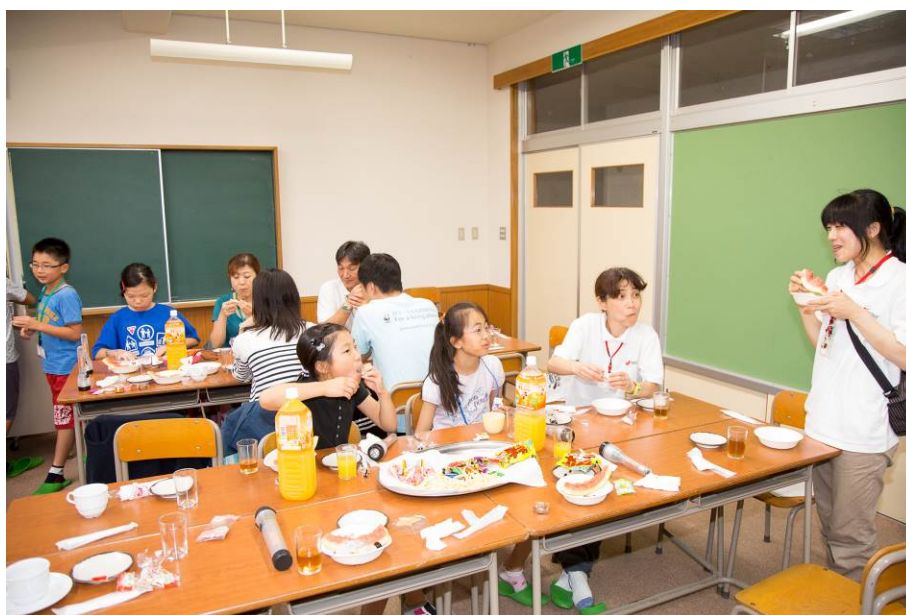
○八色スイカ！地元以外に出回らない、美味しいスイカを頂きました。

お風呂に入ったり、会場に出てきたお菓子を食べながら・・・皆さんそれぞれの夜を過ごしたのであります。