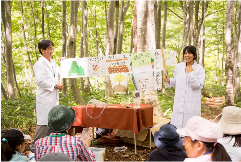
○最後は絵巻物でしめ！

楽しかったエコ×エネ体験ツアーももうすぐ終わりです。 最後は、二日間をふりかえりながら、それぞれの想いを「ブナへの手紙」としてしたためます。