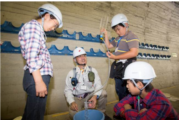
○見たばかりの発電機を、簡単な実験でおさらい。