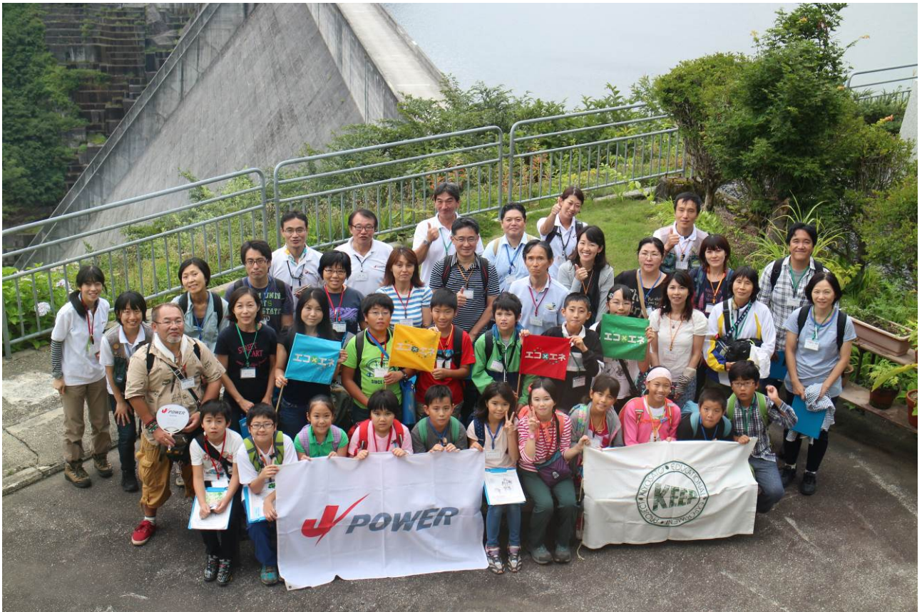
○ダムをバックに「ゲー」！