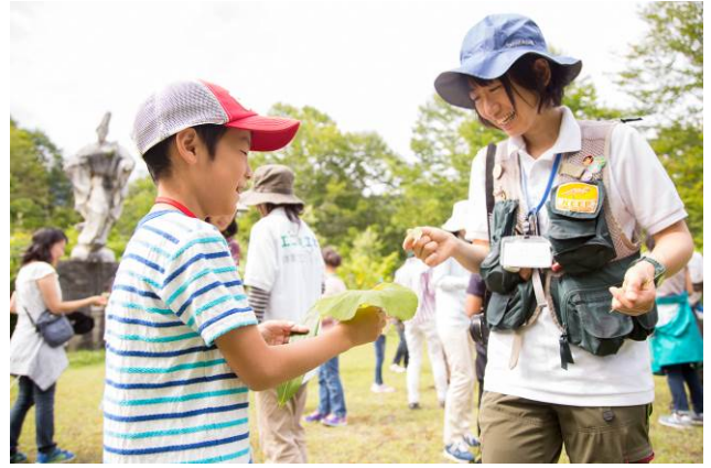
○相手と葉っぱを見比べて…。