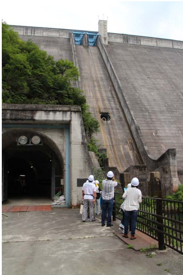
○ダムを下から見上げると…その大きさに圧倒されます。みんな写真に夢中！