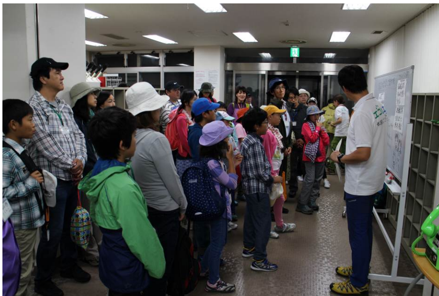
〇ますやんからのレクチャー。参加者皆さんドキドキ・わくわく。