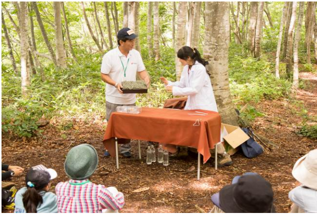
○つかみもばっちり！