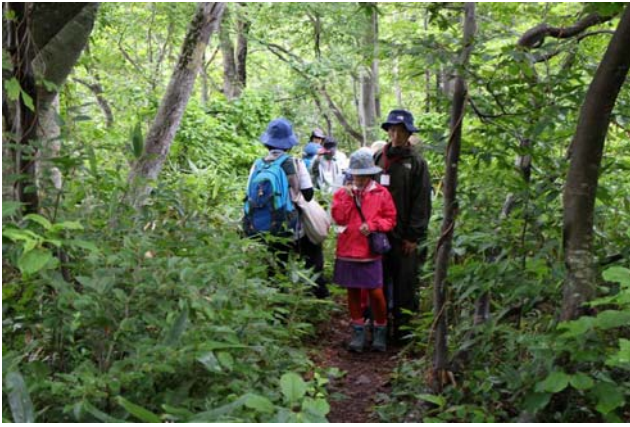
○さあ、いよいよ森へ！