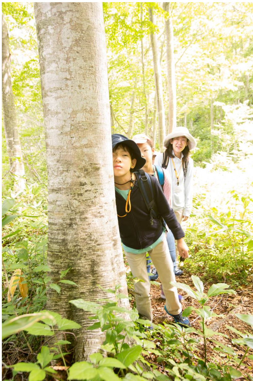
○木ってひんやりしてる！