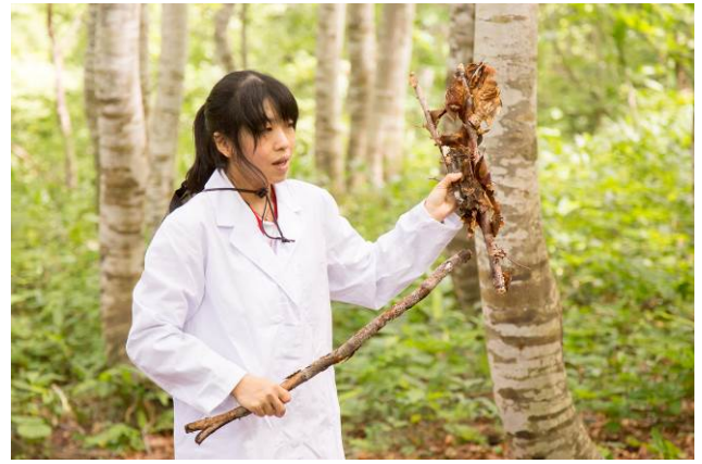
○森にあるものすべてが教材となります。