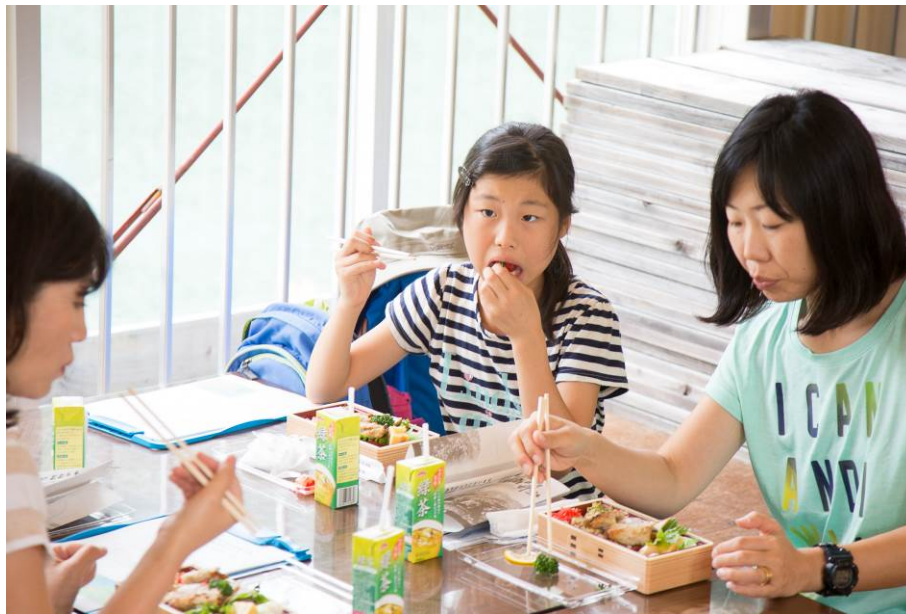
○腹ごしらえはばっちり！

お昼ご飯の後、銀山平から遊覧船しおり丸に乗船し、湖上を40分ほど移動します。 「今いるのは左手の薬指、ここから手首の位置にあるダムまで移動します！」 えー、何それすごい！！わくわくしちゃう！！