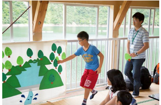
○手紙がたくさん集まって、奥只見の森になりました！