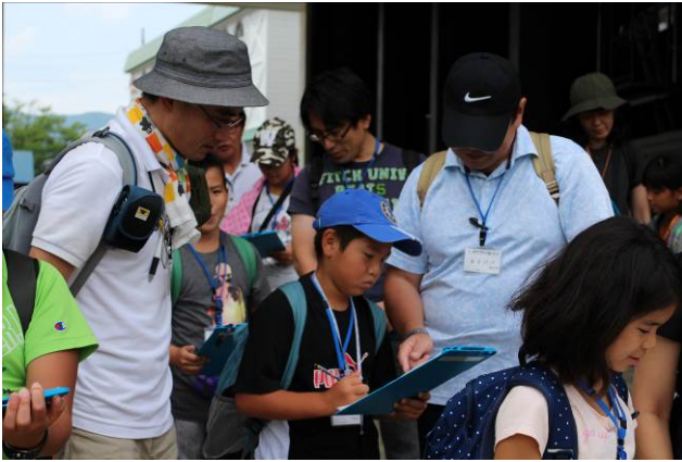
○ビンゴは中心が一番大事！どこにどのミッションを配置するかが肝です。