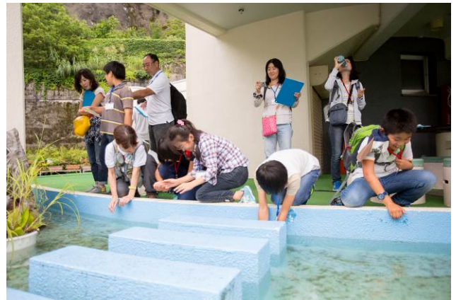
○番外編。なぜか電力館のオタマジャクシに夢中！

夕方になり、ようやく今夜の宿泊施設 「緑の学園」 にチェックインです。 お腹ペコペコお待ちかねの夜ご飯！地元新潟産の食材をふんだんに使ったメニューでした。もちろんお米は魚沼産コシヒカリ！ご飯だけでご飯が進みます！！