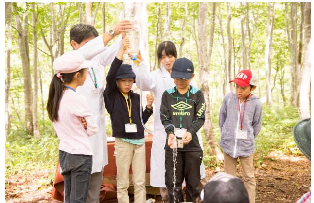
○森から流れてきた水で、「発電開始」！