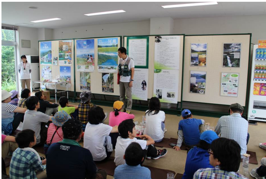
○森と水と電気のつながりは…??

ツアーのしめくくりは、「ブナへの手紙」。2日間で感じたこと、学んだことを書き出しました。