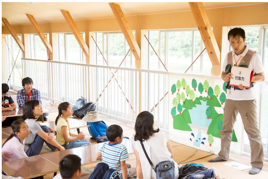
○ますやんの最後の話。「エネルギー＝行動力」！

最後のお昼ご飯は「おにぎり弁当」。みんなで別れを惜しみながら、一緒に席を囲みます。 参加者の皆さん怪我もなく、たくさんの笑顔を拝見できて、スタッフ一同元気をいただきました！