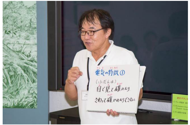
○キャップの熱弁。電気の性質についてお話しします。

参加者一同で改めて自己紹介を行います。その際、このツアーで一番楽しみにしていたことも合わせて発表しました。ここであつたのも何かの縁、みんな繋がっちゃいましょう！