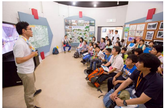
○発電所が出来た経緯を鑑賞。