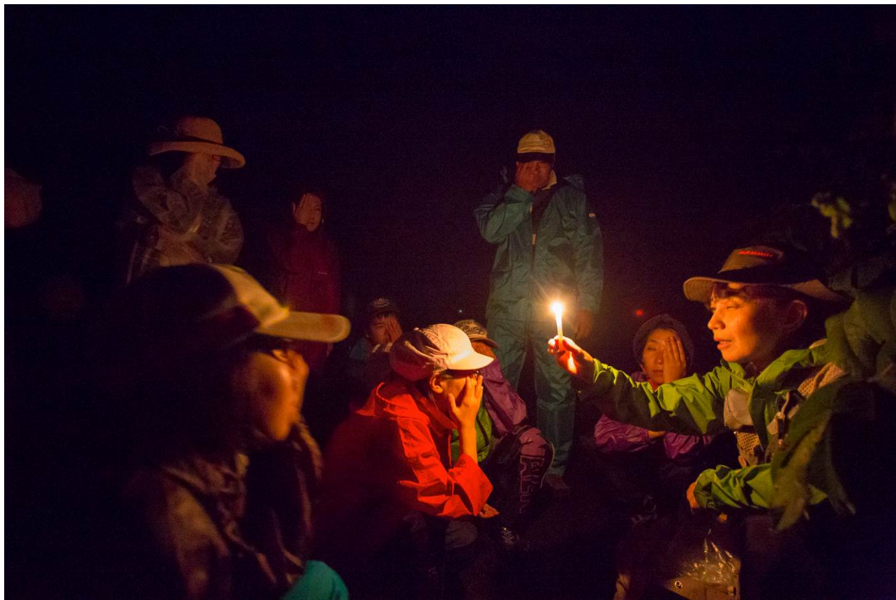
○暗闇の中のろうそくを片目で見てみたら…！？

さて、いよいよ皆さんお待ちかね「ナイトハイク」の時間です！すこし雨が降っていましたが、決行しました。いやー、ほんとに明かりの力は強いんだって実感しました。普段は何とも思わない灯りも、暗闇で過ごしてからは本当に強い刺激に思えるんです。普段便利に過ごしている分、見落としていることは多い。もっと感度良く生きていかねばと改めて思いました。