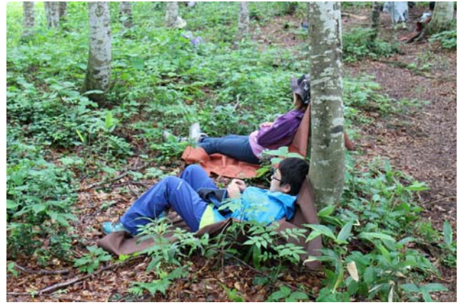
○親子でブナと寄り添います。ブナの下にいと、少しぐらいの雨は気にならないのが不思議です。