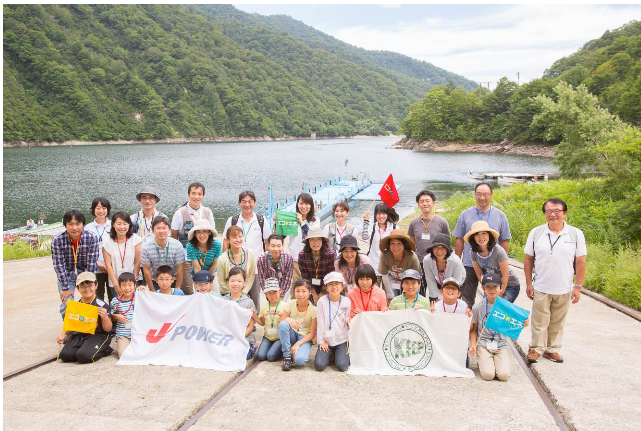
○奥只見湖をバックに、はいチーズ！

最後のお昼ご飯は「おにぎり弁当」。みんなで別れを惜しみながら、一緒に席を囲みます。 参加者の皆さん怪我もなく、たくさんの笑顔を拝見できて、スタッフ一同元気をいただきました！