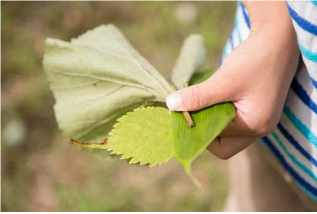
○ヒント！色々な葉っぱを持っていた方が有利なんです。