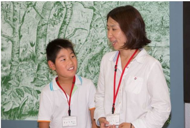
○親子ならんで自己紹介。

参加者一同で改めて自己紹介を行います。その際、このツアーで一番楽しみにしていたことも合わせて発表しました。ここであつたのも何かの縁、みんな繋がっちゃいましょう！