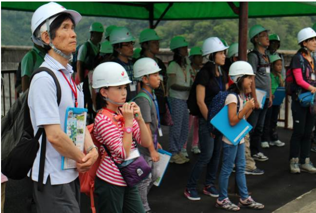
○ピリッとした顔。ヘルメットを被ると気分が引き締まります。

船酔いする時間もないぐらい、楽しくビンゴをして過ごしました！ さてさて、いよいよ本日のメイン。発電所見学へGO！