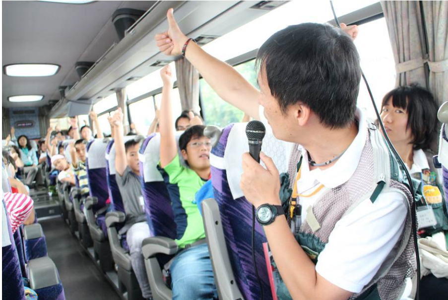
○「今日の調子は？」「こんな感じー！」