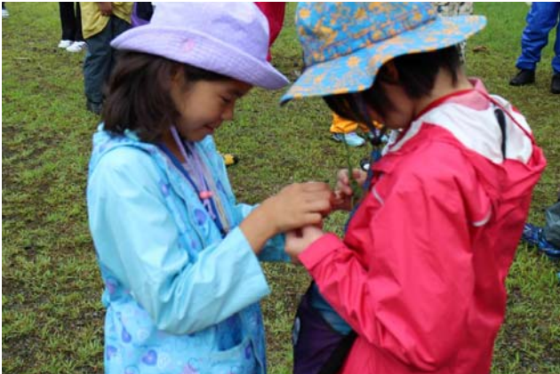
○葉っぱっぱ！さあ、どっちの勝ちかな？

朝ご飯を食べたら緑の学園をチェックアウト。名残惜しいですが、ブナの森が待っています。おっと、ブナの森に入る前には、銀山平名物のアレが待っています！