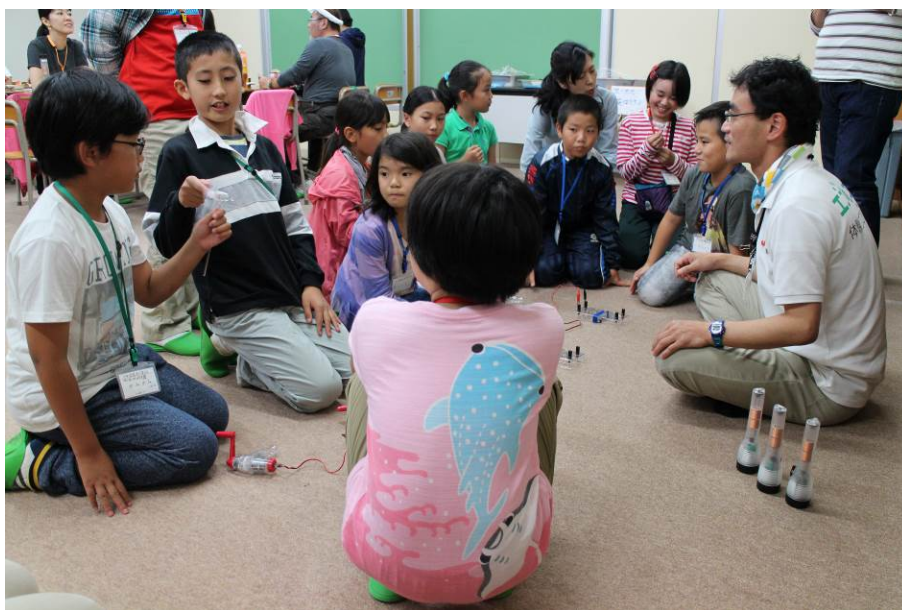
〇A日程に続き、またもや囲まれるキンちゃん。スタッフ冥利に尽きる！

ナイトハイクのままのテンションじゃ眠れない！でも自由交流会でさらにテンションが上がる子たちも…。