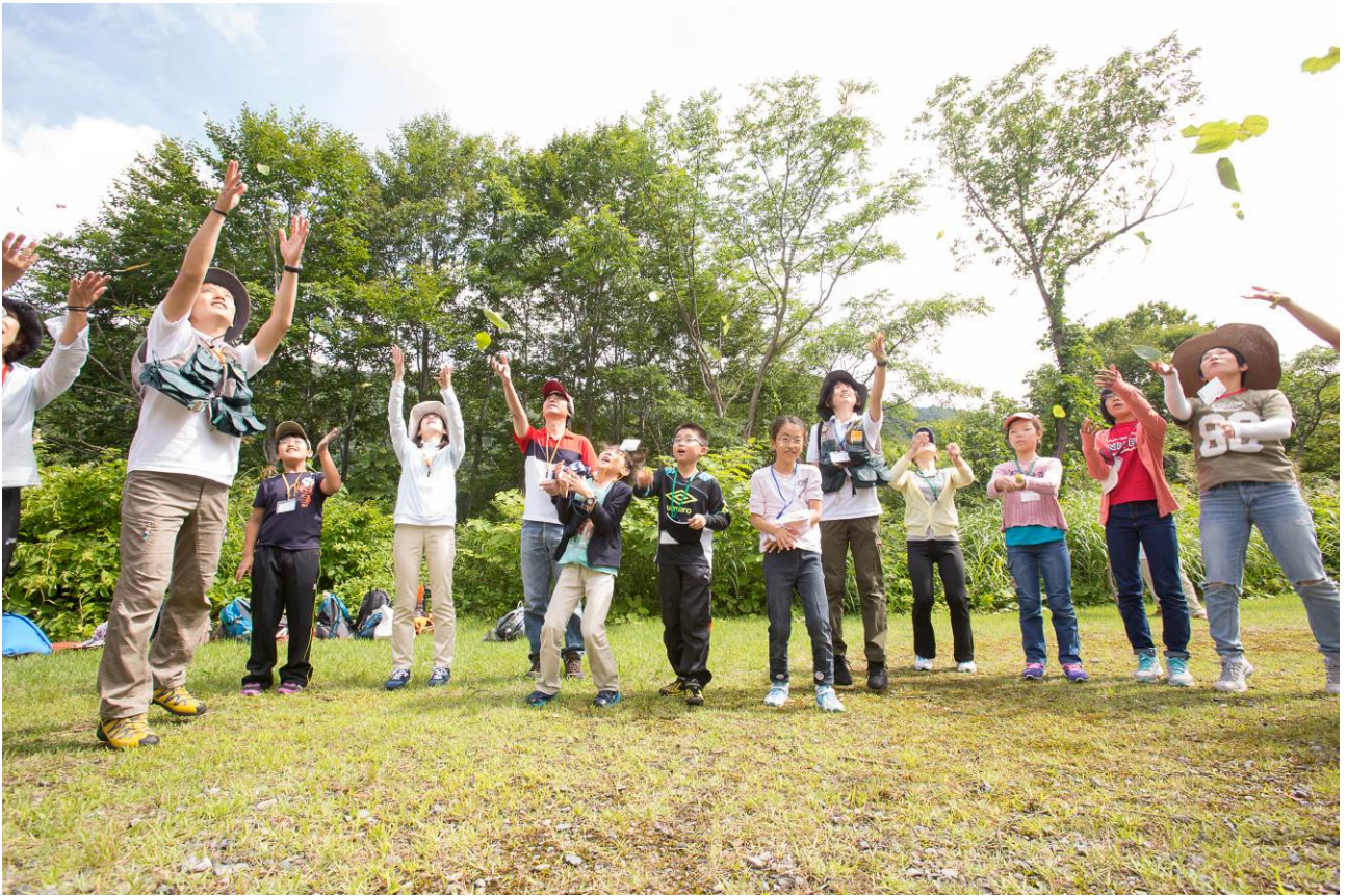
○使った葉っぱはお空に返します。

さてさて、いよいよブナの森へ。 奥へ進むごとに暑さも気にならなくなります。森ってこんな力もあったのかと、実感できました。