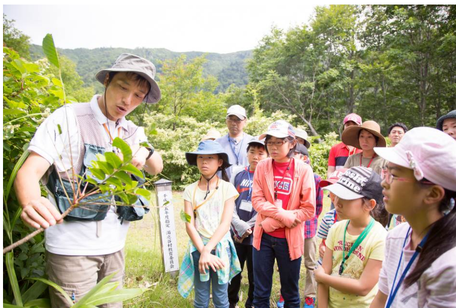
○ますやんは森の おとこ 漢だから大丈夫！よい子のみんなはマネしちゃだめよ！

…っとその前に、森には危険がいっぱい！危険は分かれば避けられる！ということで、ますやんから「うるし」のレクチャーを受けます。