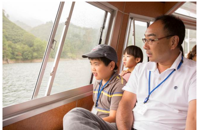
○ちょっと小雨が降っているけど、それもまた神秘的。