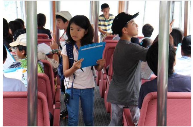
○船の中できよろきよろ。

船酔いする時間もないぐらい、楽しくビンゴをして過ごしました！ さてさて、いよいよ本日のメイン。発電所見学へGO！