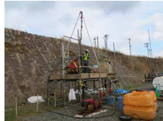
図2 ボーリング調査作業状況(事例)