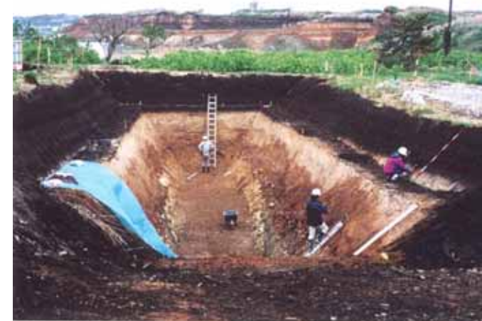
図4 トレンチ調査作業状況(事例)