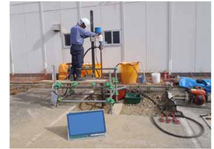
図3 コアドリルを用いた試料採取状況(事例)