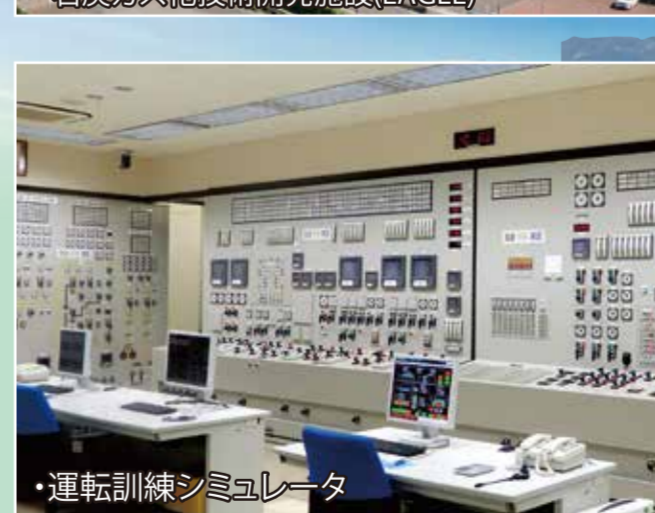
●運転訓練シミュレータ