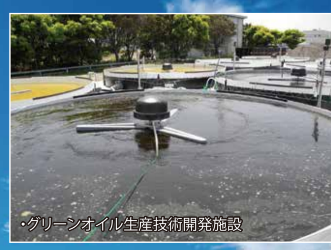
●洋上風力発電の紹介