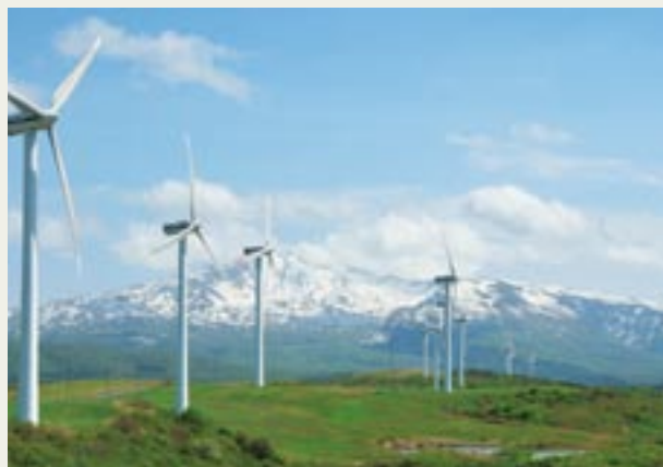
仁賀保高原風力発電所(秋田県)