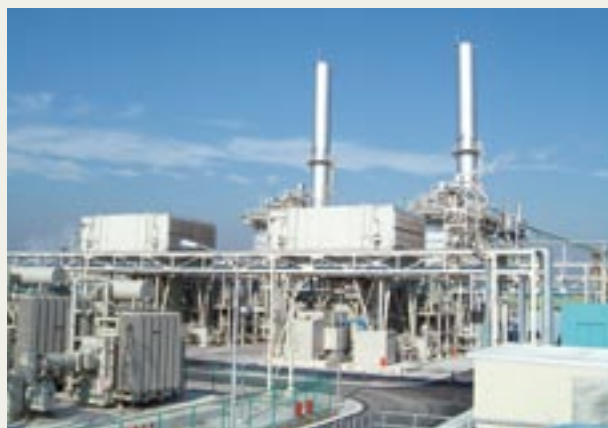
ベイサイドエナジー市原発電所(千葉県)