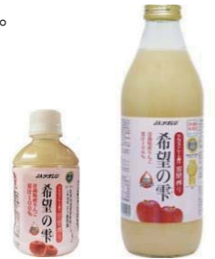
希望の雫 ペットボトル1本¥150 瓶1本¥370

このほかにも多数商品を揃えてお待ちしております! 数量限定販売となります。売り切れの際はご了承ください。※価格はいずれも税込