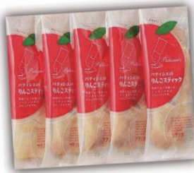
りんごスティックパイ 1個¥160/1箱¥780