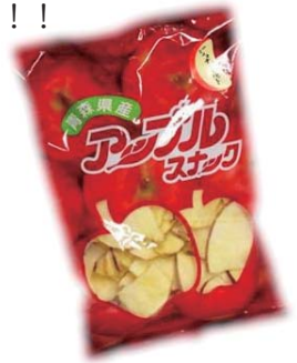
アップルスナック ¥400