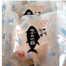
大間・まぐろフッセ ¥140