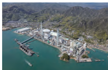
竹原火力発電所新1号機