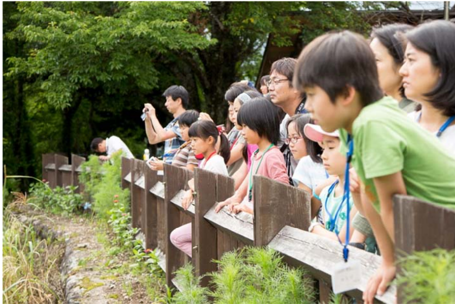
○ダムに沈んでしまった集落にも思いを馳せます。