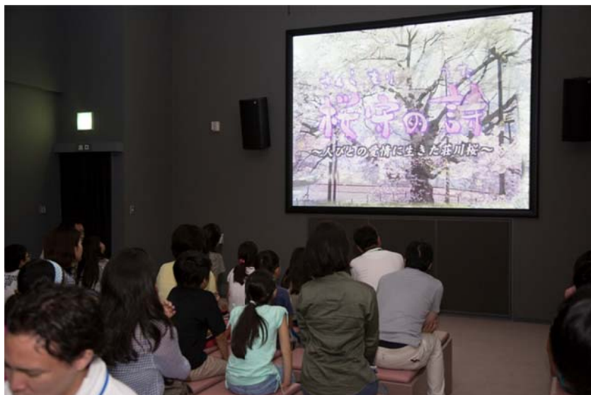
○OMIBOROダムサイドパークでは、御母衣発電所建設時の話である「桜守の詩」を鑑賞。 普段何気なく使っている電気にはこんな物語も…。