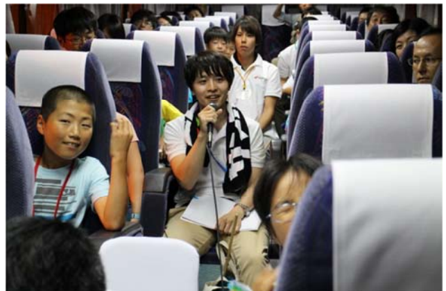
○リーダーの普段のお仕事も紹介。「24時間働いています！」とゆっきー。