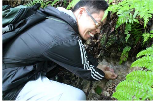
○源流を見つけた、カトちゃん的笑顔！

源流の森ウォークで運動した後は、おいしい朝ご飯！ ビュッフェでしっかり食べ、お待ちかねの川遊びを行いました。