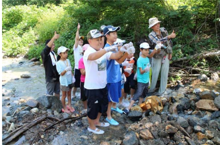
○ロックフィルダム（ダムの建設様式のひとつ）と発電所。見事、発電出来ました！

最後は「まとめのワークショップ」。ドクターの実験です。そして、ツアー全体の締めは、荘川桜です。