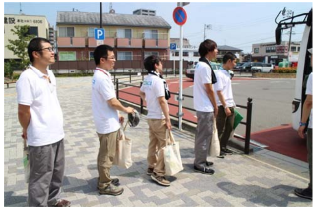
○どきどきのリーダーたち。