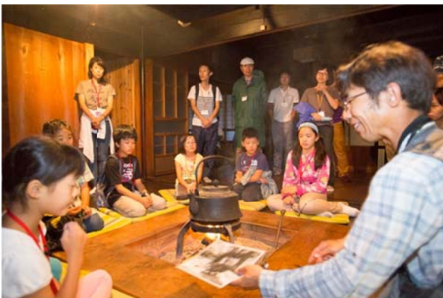
○合掌家屋にも上座と下座が！

いろりを囲んで、ばるきーのお話。昔の白川村の生活、薪のくべ方、その薪をどのように持ってくるか…。火を囲んで、穏やかなばるきーの声に耳を傾けていると、昔の風景が目の前に浮かんでくるようでした。