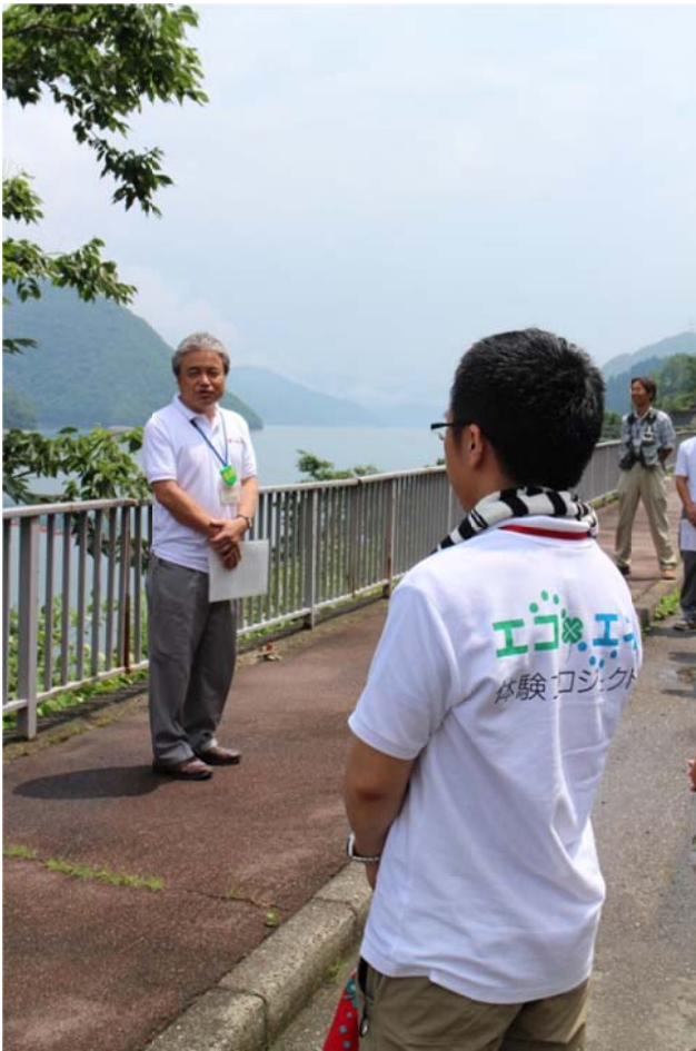
○御母衣電力所の山下所長がお出迎え。