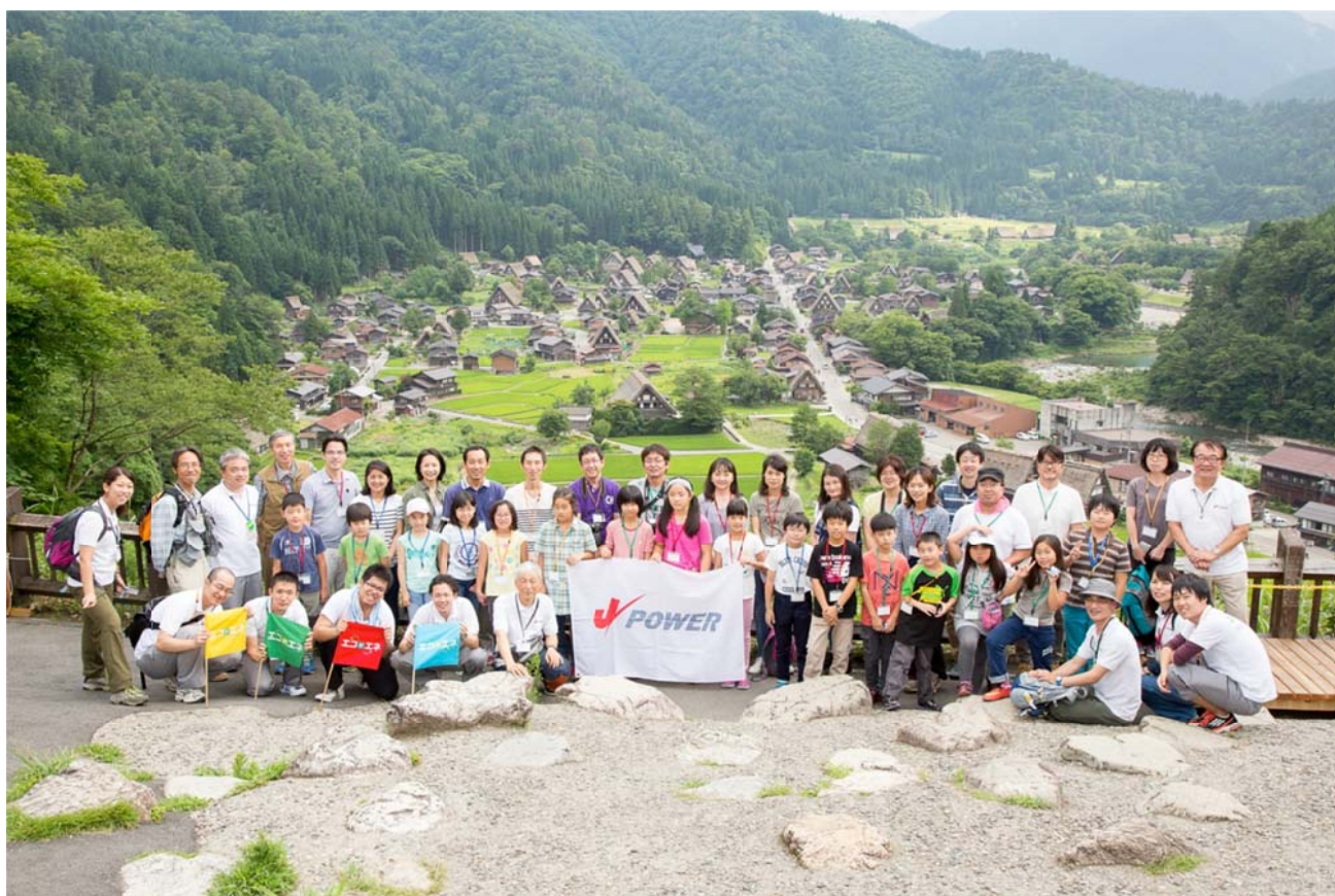
○世界遺産白川郷をバックに全員で記念撮影！

発電所の見学後は、世界遺産の白川郷合掌造り集落を展望台から眺めます。展望台だから集落の様子が一目瞭然。…あれ、上から見るとおうちが同じ方向を向いているよ。何でだろうと思っていたら、ぱるきーが解説してくれました。その途中、なぞの生物のぬいぐるみが！！欲しいと思ったのは私ぐらいじゃないかな、でも白くておっきくてカワイイ（さて、何でしょう??）。