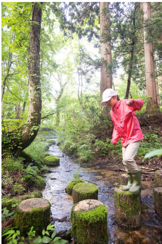
○源流はどこだ！朝から探検！