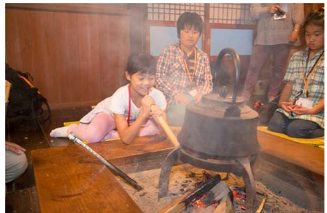
○ふーっとふくだけでもコツがいります。