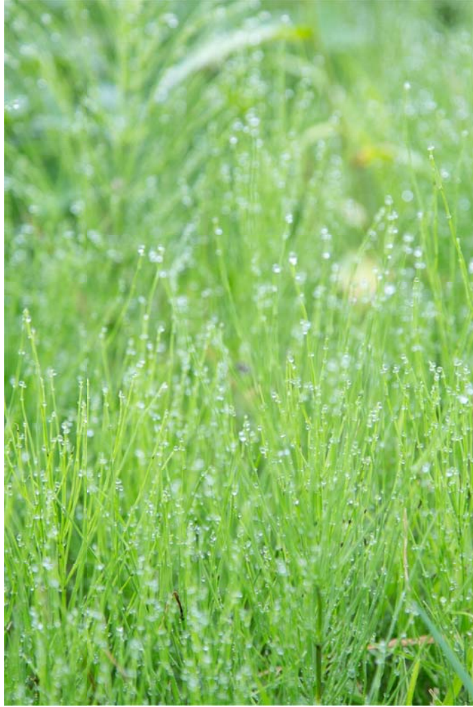
○雨も止んだ！朝露がきれい～！