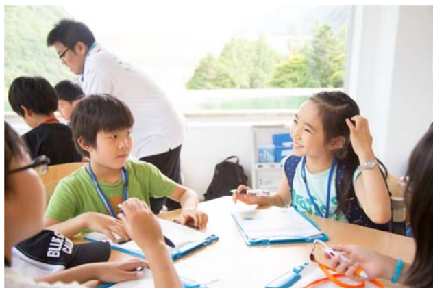
○「発電所で見たあれは何だっけ？」

最後に発電所の見学のみどころとして、見学してきたことをもとに「クイズづくり」にチャレンジしました！今回初めての試みでしたが、なかなかの難問揃い…。ちゃんと見学が身につけていました！