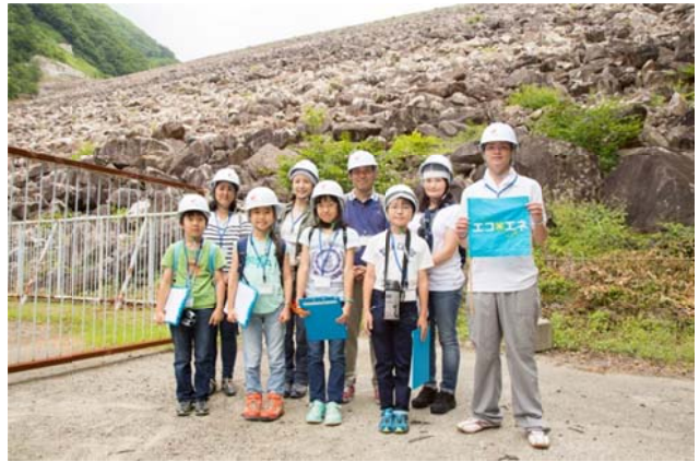
○ダムを下から見上げると、また違う迫力が。