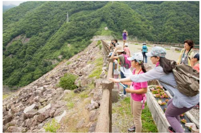
○ダムを上から見ると…ちょっと怖い！

ここまで見学したところで、いよいよお昼ご飯です！お腹もすいていたので、とっても美味しかったです！そして、参加者の皆さんとたくさんお話ができたこともうれしかったです！