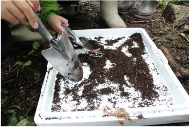
○土の中から、何かを発見！