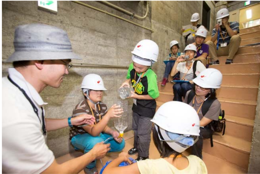
○見学した発電所の仕組みを実験で振り返ります。