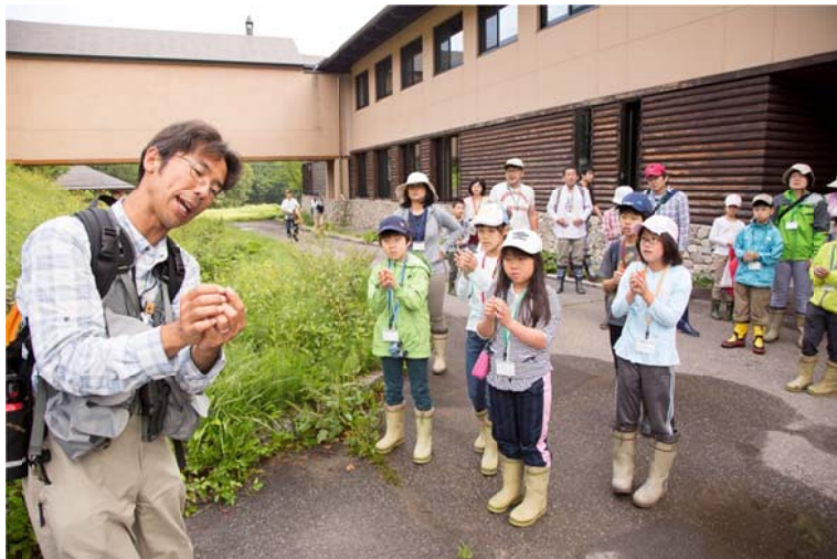
○途中で道草。ぱるきーが草笛を教えてくださいます。