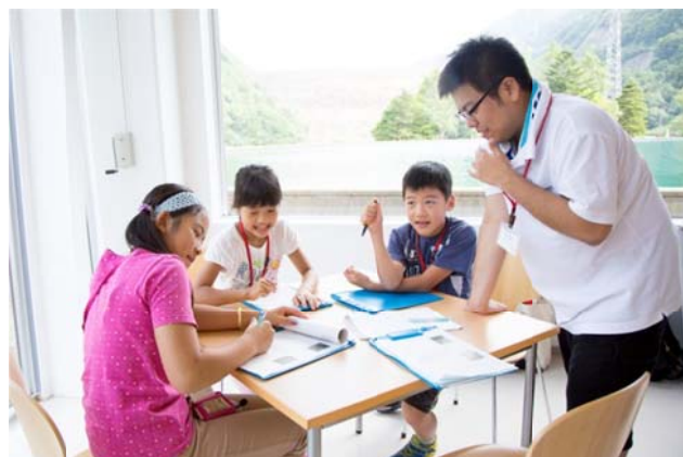
○リーダーも一緒に考えます。

発電所の見学後は、世界遺産の白川郷合掌造り集落を展望台から眺めます。展望台だから集落の様子が一目瞭然。…あれ、上から見るとおうちが同じ方向を向いているよ。何でだろうと思っていたら、ぱるきーが解説してくれました。その途中、なぞの生物のぬいぐるみが！！欲しいと思ったのは私ぐらいじゃないかな、でも白くておっきくてカワイイ（さて、何でしょう??）。