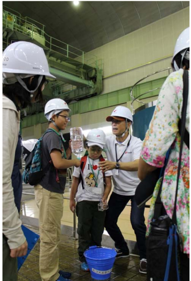
○水力発電を小さなキットで理解。